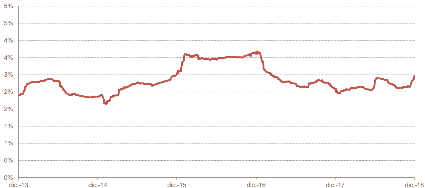
SGI Smart Market Neutral Commodity Index